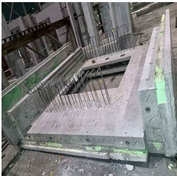
图 1 PC 预制构件俯视图