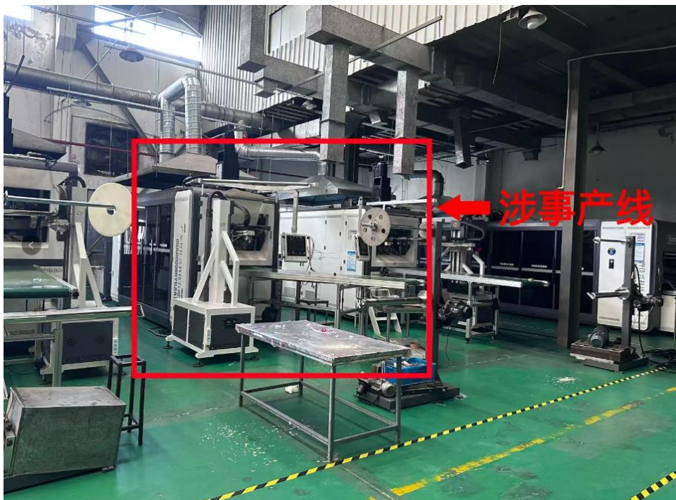
图 1 涉事产线照片

验收确认后形成书面设备验收报告。产线工作原理：通过信号触发与响应，制杯机完成产品成型后，通过 PLC 发出就绪信号，机械手控制系统启动抓取程序。机械手通过真空吸盘抓取堆叠产品按预设姿态堆叠至输送带，计数器实时记录堆叠数量，达到设定堆叠数量后，输送带启动，将成品送至下一工序。